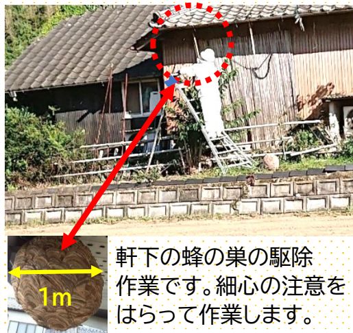
軒下の蜂の巣の駆除 作業です。細心の注意を はらって作業します。

蜂の活動時期は3月～11月 時間帯は6時から21時です。 働き蜂の一日の基本サイクルは 朝に出かけて 日中に餌を探し 日没後に巣に帰る まるで○○のようですね。