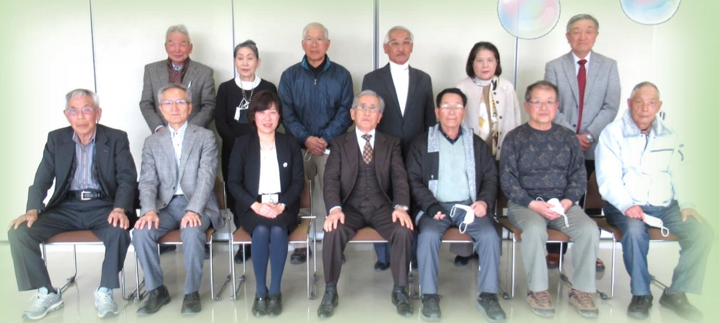
宇佐市シルバー人材センター 役員一同