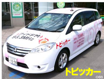
OBSラジオ「モーニング・エナジー」に番組出演しました。