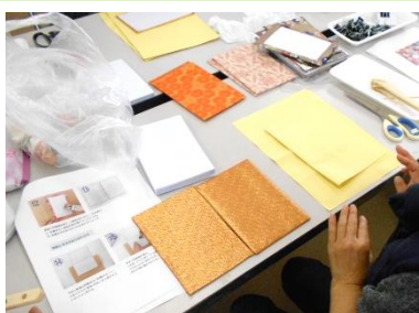
表紙の布を選んで貼りつけます。