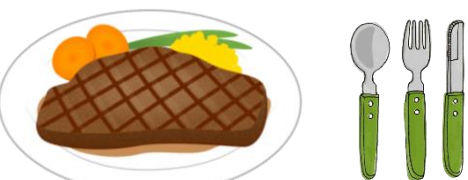
サーロインステーキ1枚